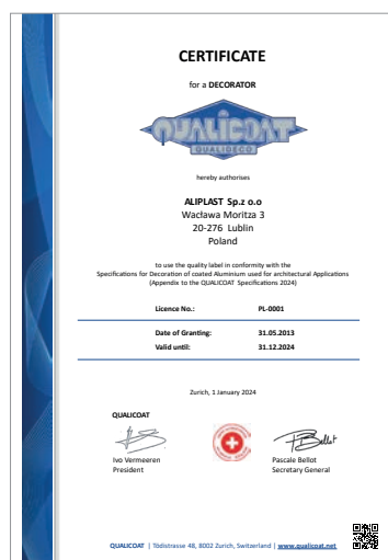
Certifikát Qualicoat QUALIDECO - dekorativní úpravy povrchu hliníku